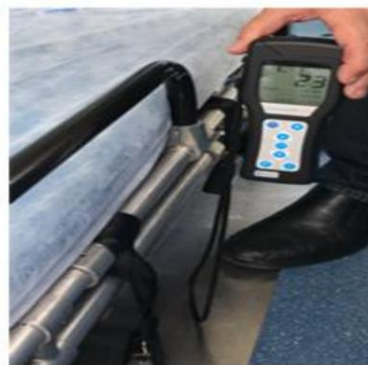
DEPOIS – 23 RLUs