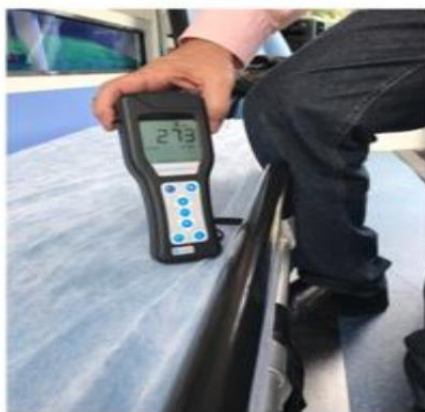
ANTES – 273 RLUs